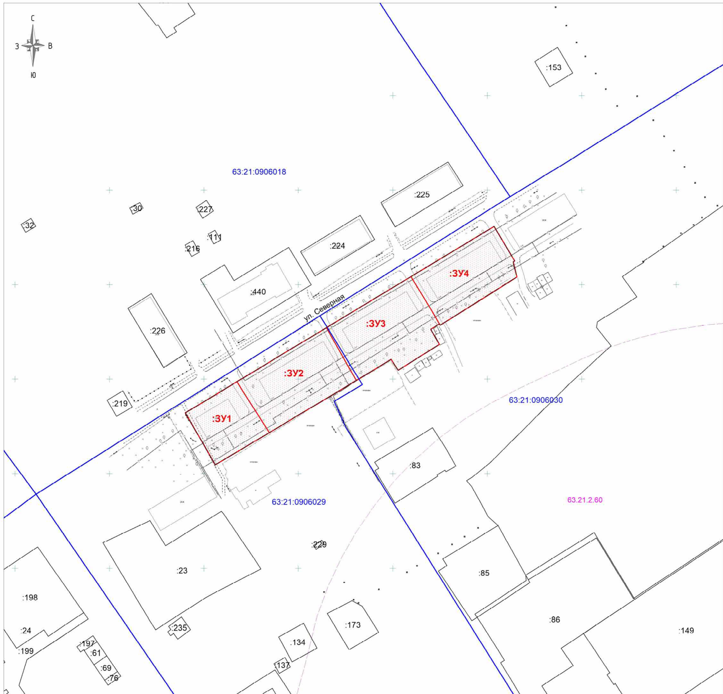
Схема расположения земельных участков в границах элемента планировочной структуры